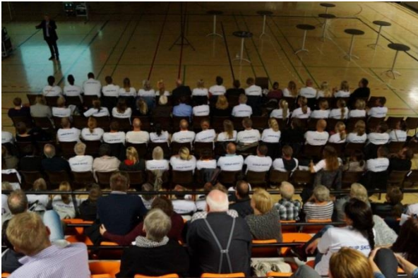
Skoleborgermøde i Ulvehøj Hallen – Radikales udspil vil forhindre Vorup Skole lukkes, super-overbygningsskolen i Sydbyen forhindres, samt alle overbygningsskoler tages af bordet – det er påvist at elever lærer mindre på overbygningsskoler end i enhedsskoler.

personaledækning på området, men også til en generel opgradering af det meget slidte udstyr.