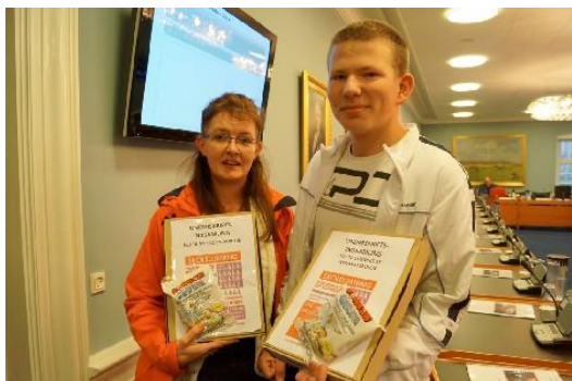
Mere end 4000 underskrifter imod skolestrukturudspillet fra VAO er afleveret til borgmesteren – billedet taget den 27. oktober – pt. er der 9332 elever i kommunes folkeskoler.

Bevarelse af lokale folkeskoler betyder bevarelse af lokale kulturhuse