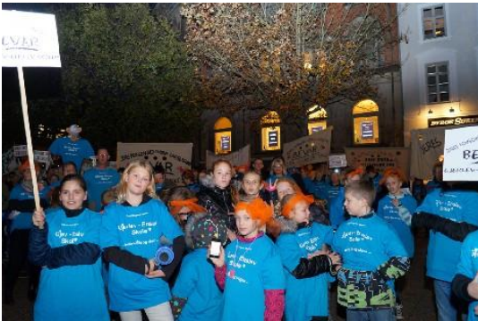
Fem skoler lukkes ikke med Radikale Venstres udspil, og eleverne på billedet skal fortsætte på deres landsbyskole i Gjerlev efter sommerferien.

En anden måde at øge mangfoldigheden på den enkelte skole, er ved at øge samarbejde mellem skolerne. Det kan gøres omkring forskellige projektføløb, men også ved at tilskynde til at flere skoler går sammen om at ansætte lærere med særlige kompetencer, som man evt. ikke kan få dækket på den enkelte skole.