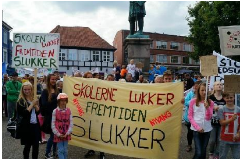
Forældrene og børnene har ret i, at deres fremtid bliver mindre god ved skolelukninger, mens privatskolerne får kronede dage (kilde CEPOS arbejdspapir nr. 21)